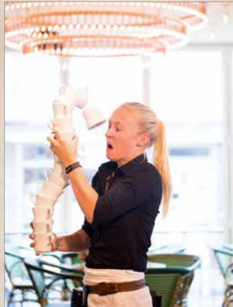
Die künstlich herbeigeführte Halbwertszeit von Kaffeetassen beträgt übrigens 25 Tage. Die dafür benötigte Konstante sehen Sie im Bild rechts.

Wir verfügen über eine der modernsten Kaffeemaschinen Europas. Im Gegensatz zu den herkömmlichen Filterverfahren wird bei unserer Kaffeemaschine der Kaffee nicht mit 100 Grad aufgeschwemmt, sondern jede Tasse frisch gebrüht und mit 11 bar Druck und max. 94 Grad in wenigen Sekunden zubereitet. Testen Sie selbst, Sie werden begeistert sein.