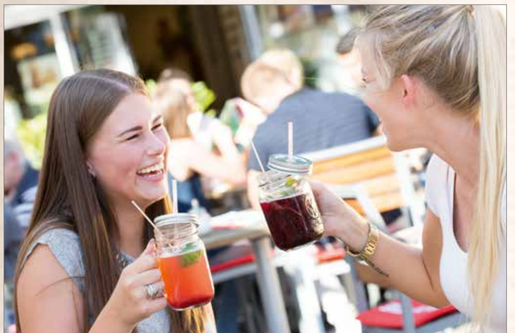
Das Amt für Schönwetterwolken rät: „Bei extremer Sonneneinstrahlung sollten Sie nach jedem Strohhalm greifen!“